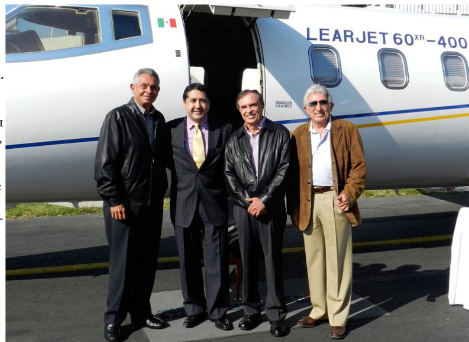
Руководители Cinopolis и Bombardier Business Aircraft празднуют передачу 400-го Learjet 60

Нынешняя модификация среднего бизнес-джета семейства Learjet 60, 60XR, находится в эксплуата-