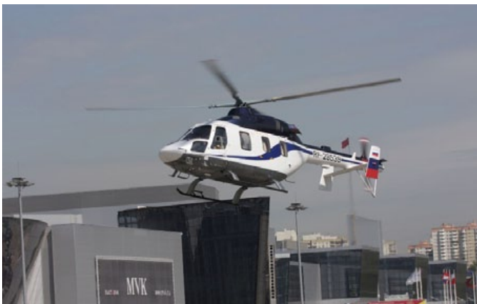
Казанский «Ансат» прилетел в Крокус Экспо

Емкость российского рынка не осталась незамеченной ведущими игроками мирового вертолетного сообщества, еще не вышедшими на арену России. Впервые за долгие годы американская компания Sikorsky Aircraft Corporation решила представить свои разработки в России. На HeliRussia 2011 на стенде компании можно будет ознакомиться с предложениями компании для российского рынка. Российская выставочная площадка для компаний вертолетной индустрии HeliRussia уже зарекомендовала себя в качестве плацдарма для выхода на мировой и европейский рынки. В этом году в Москве состоится европейская премьера первого швейцарского вертолета. Компания Marenco Swisshelicopter Ltd. представит полноразмерную экспериментальную модель легкого вертолета SKYe SH09 взлетной массой 2,5 т. Обладая крейсерской скоростью 270 км/ч, он сможет преодолевать свыше