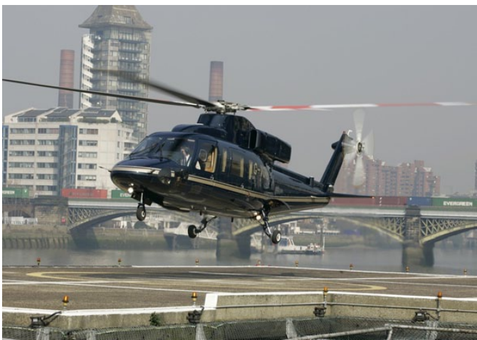
Лондонский Heliport уже давно работает

На самом деле, уже давно назревает потребность в развитии в крупных городах России вертолетных пассажирских перевозок. И то, что возведение вертодромов приурочивается только к каким-то важным межгосударственным мероприятиям, не совсем правильно. Хотя эти идеи самым серьезным образом обсуждаются в Санкт-Петербурге и Москве, до конкретных шагов власти пока еще не созрели. Причем, если в Питере уже есть опыт полетов над городом по руслу Невы и особых проблем с силовыми ведомствами нет, то в Москве, несмотря на потенциально огромный рынок таких услуг, основным препятствием служат как раз силовики. А особая привлекательность вертолетного такси